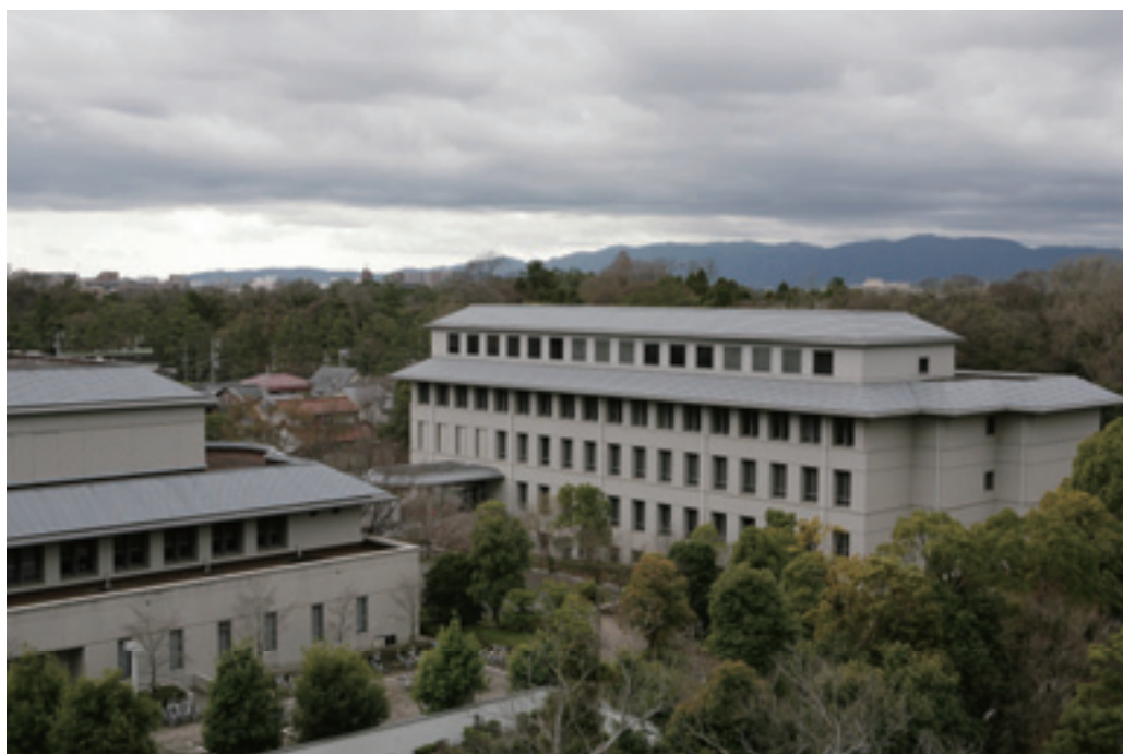
左は図書館、右は医学部看護学科校舎.