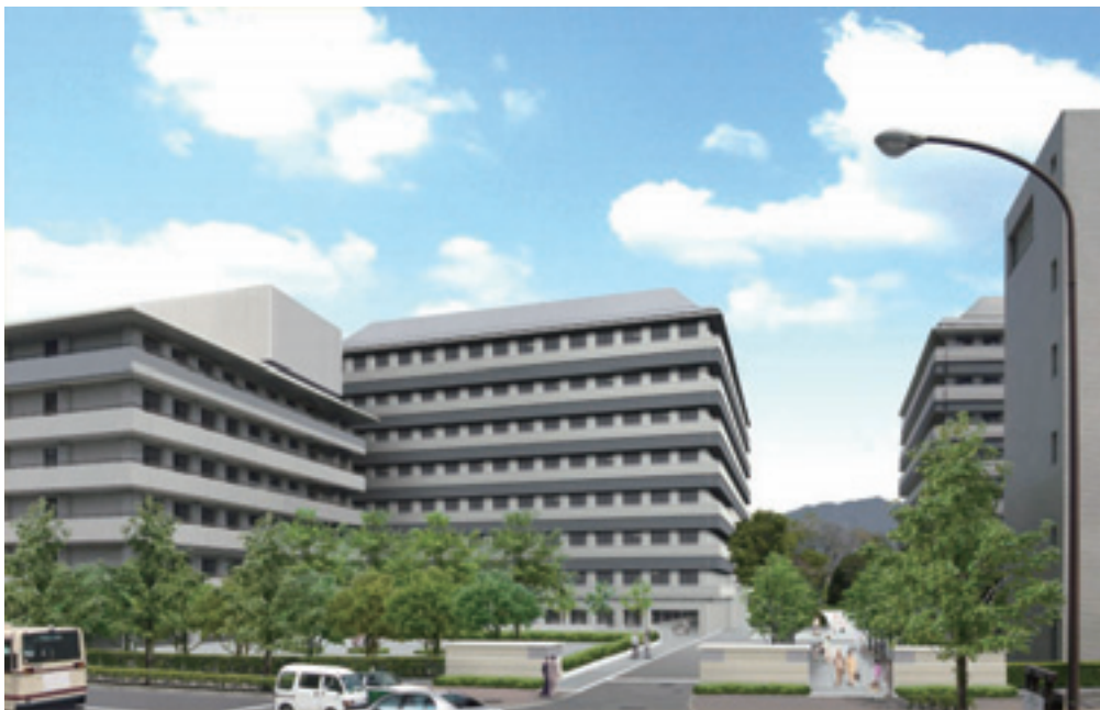
生まれ変わる病院玄関