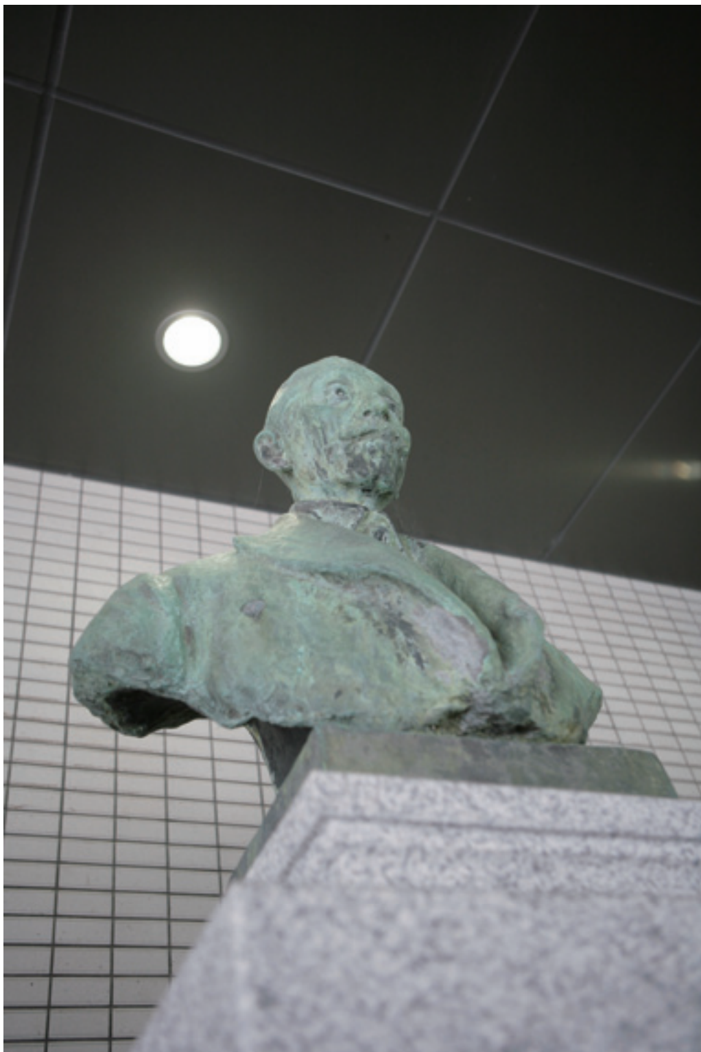
島邨先生、法人化後もよろしく.