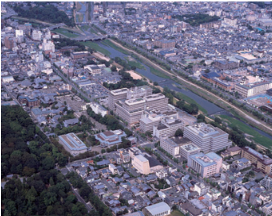
京都府立医科大学キャンパスの航空写真.