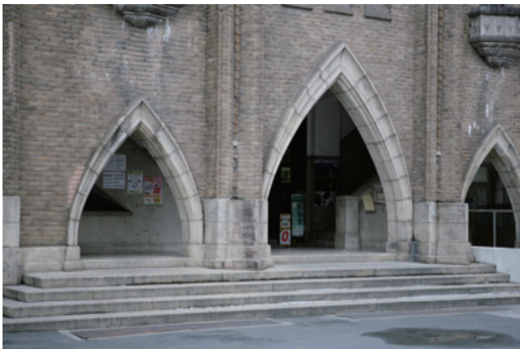
旧図書館玄関アーケード.