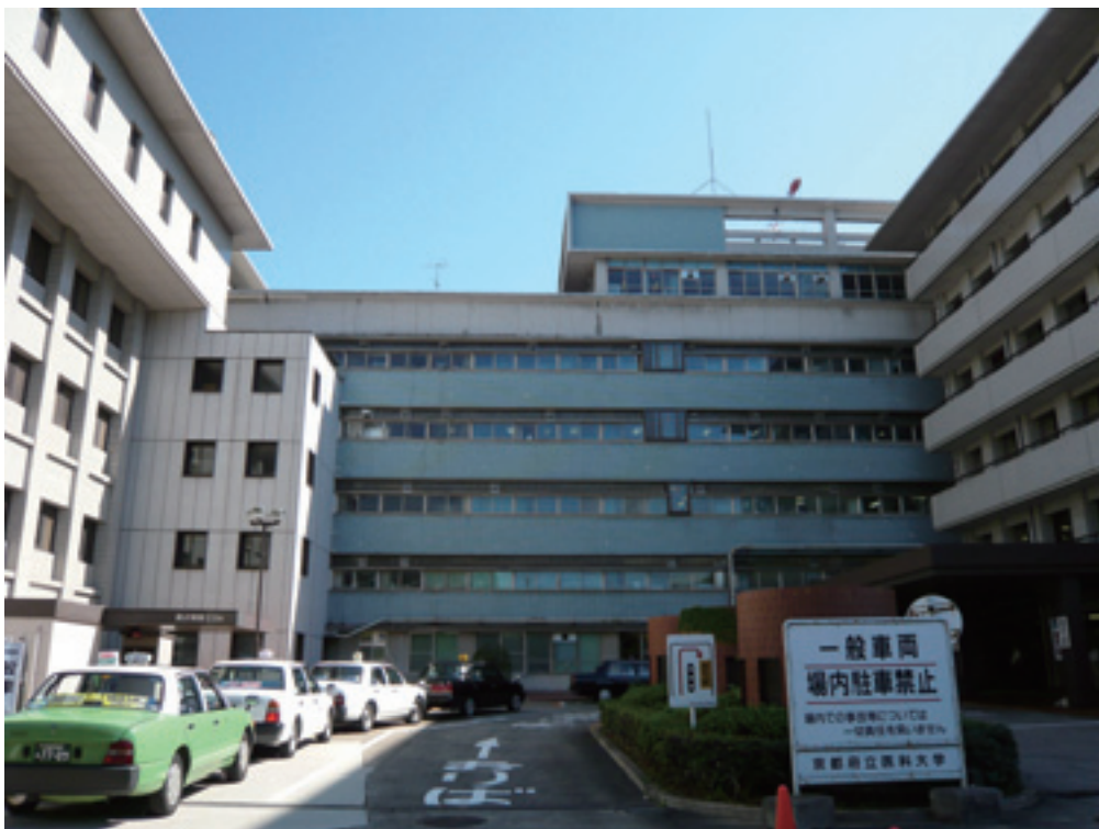
2007 年 10 月 11 日の病院玄関.