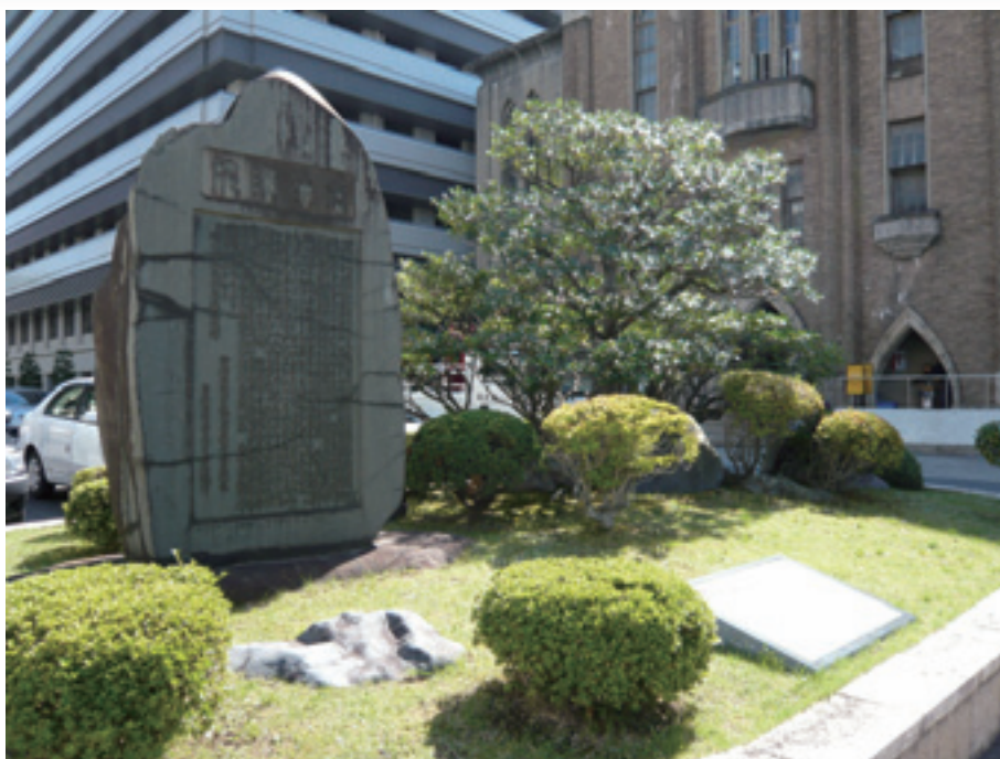
外来診療棟旧図書館も石碑もそのまま残る。