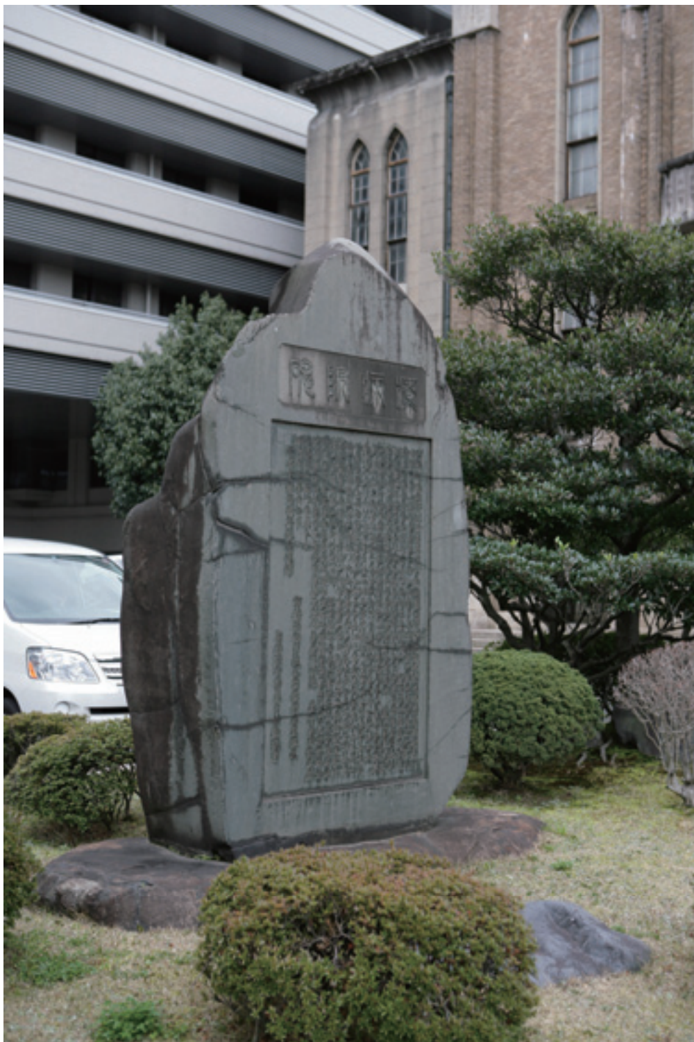
本学設立の理念を示す療病院碑.