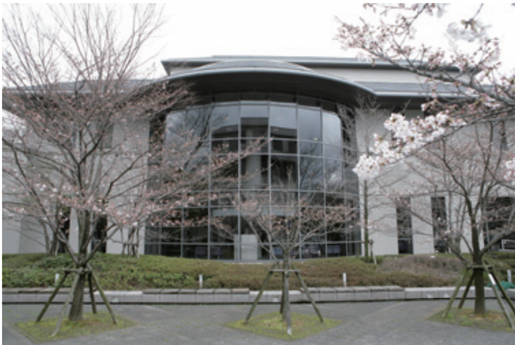
新図書館ロビーを屋外より眺める.