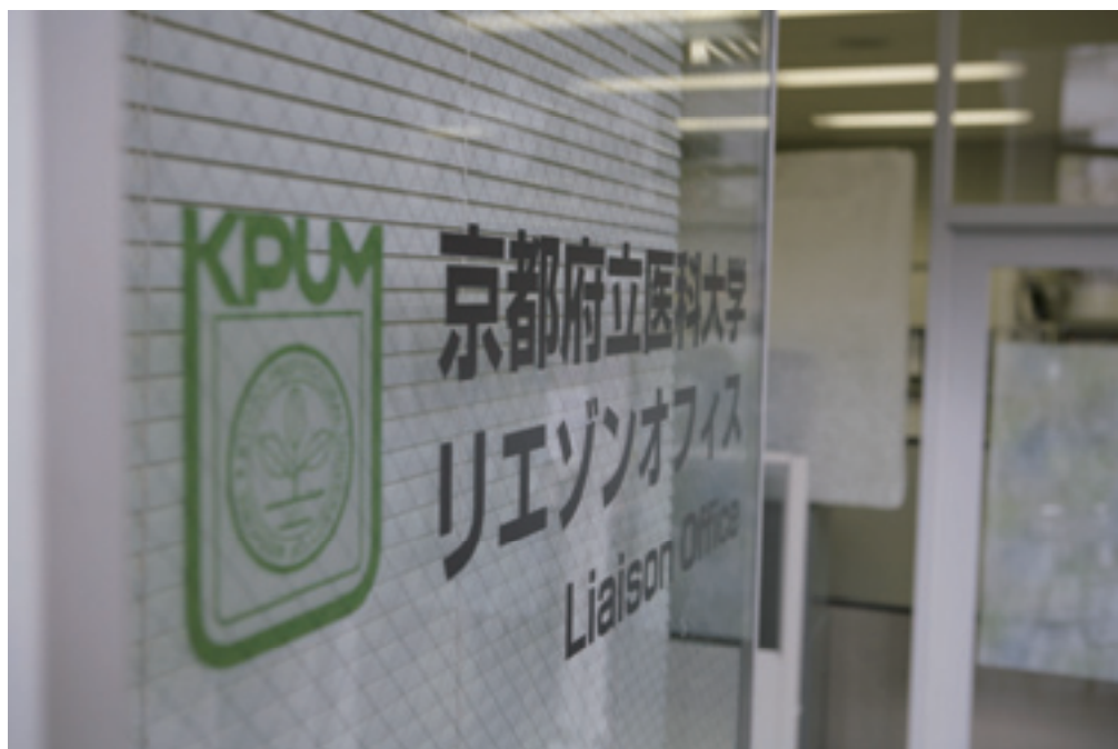
法人化の後には主役になるリエゾンオフィス.