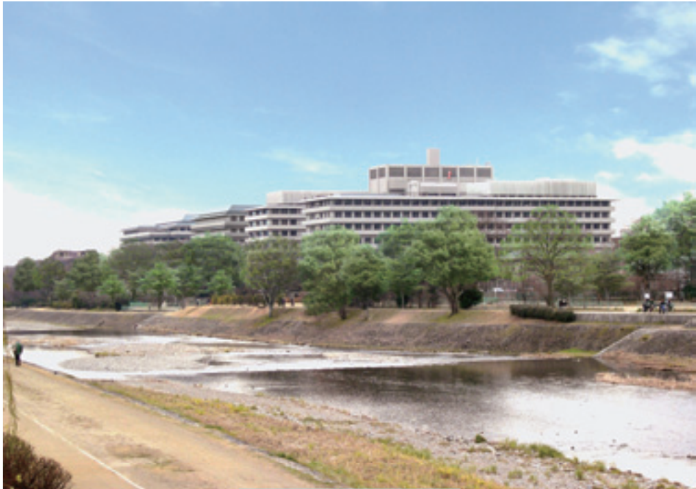
加茂川より眺める大学.