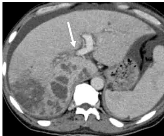
図 1 腹部造影 CT

以上の所見より、難治性腹水は進行肝内胆管癌による門脈圧亢進に起因した肝性腹水と判断した。先行治療に抵抗性で、かつ代替治療がないため、IVR を考慮した。本例は担当がん例ではあるが、腹水性状ががん性でなく肝性であることから TIPS を適用した。患者の文書同意を得て、局所麻酔下に施術した。大腿動脈穿刺法により上腸間膜動脈にカテーテルを進めて経動脈性門脈造影を行い門脈血流を評価した (図 2a)。エコー下に右内頸静脈を穿刺、6.5-F マルチパーパス型カテーテル (シーキング No1, ハナコメディカル社, 日本) を左肝静脈に進め、0.035inch ガイドワイヤー (Amplatz Extrastiff Guidewire, COOK 社, USA) を用いて、10-F シース経由で 10-F Rosch-Uchida transjugular access kit (RUPS, COOK 社, USA) を左肝静脈