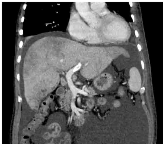
図4 腹部造影CT（術2日後） ステント内に造影効果が認められ、TIPS経路の良好な開存が確認できる。

多施設ケースシリーズによれば83%の高い症状改善率の一方で、血液凝固異常やカテーテル不具合を含む45%の有害事象率が報告されている 3) 。このうち重篤な有害事象であるDICの発生頻度は腹水性状により異なり、浸出性のがん性腹水では5%程度だが、漏出性の肝性ないし硬変性腹水では25%に及ぶ 2)3) 。一方、TIPSは門脈と下大静脈間に造設した肝内短絡を介して門脈減圧を図ることによって腹水吸収を促進させる 4)5) 。Eck瘻や遠位脾腎シャント術等の外科治療を代替する低侵襲治療であり、肝移植待機例、出血性消化管静脈瘤、門脈圧亢進症性胃腸症、門脈血栓症、難治性腹水に適用される。特に難治性腹水に対してはレベル1の高いエビデンスが知られている 6) 。TIPSの作用機序により、その対象となる腹水は門脈圧亢進症を伴う肝性ないし硬変性に限定される。TIPSによる腹水消失率は74%と高く、腹水穿刺排液療法に比べ再発率も低い 7) 。またTIPSはPVSと比べて長期開存が望める 8) 。しかしながら、本療法に特異的な有害事象として、門脈穿刺