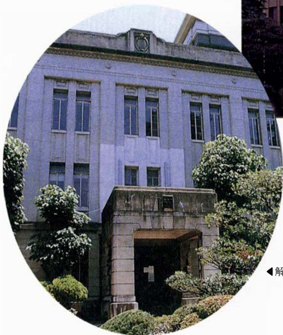
◀解体直前の大学本館（1997年）