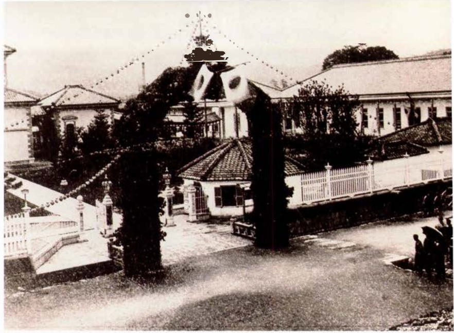
▶京都府療病院医学校竣工 (1880年)