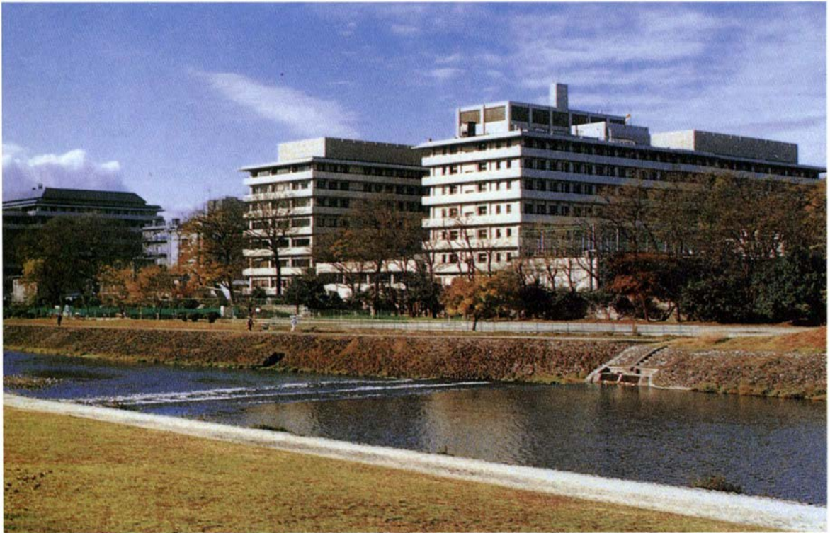
▲鴨川から府立医大を望む