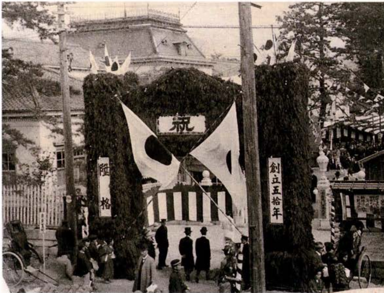
◀京都府立医科大学に昇格、創立50周年 (1921年)