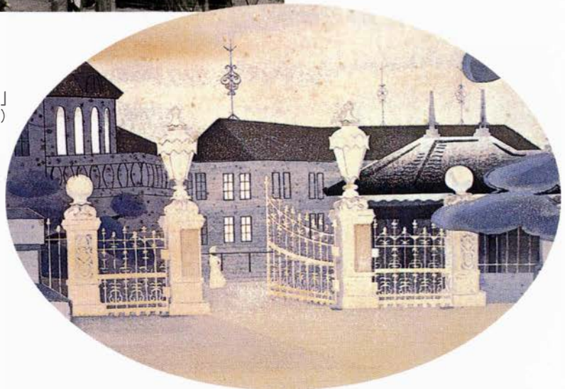
▶徳力富吉郎作「白い門」 (版画)