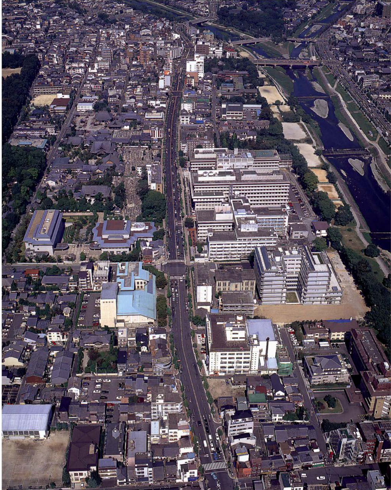
▲京都府立医科大学全景（1997年）