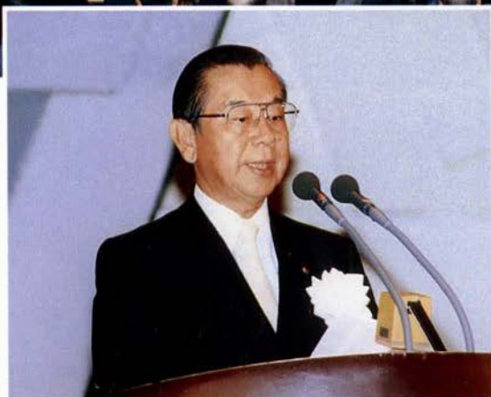
▲荒巻禎一京都府知事告辞