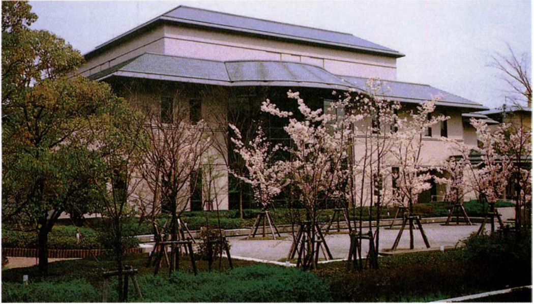
▲附属図書館完成（1992年）