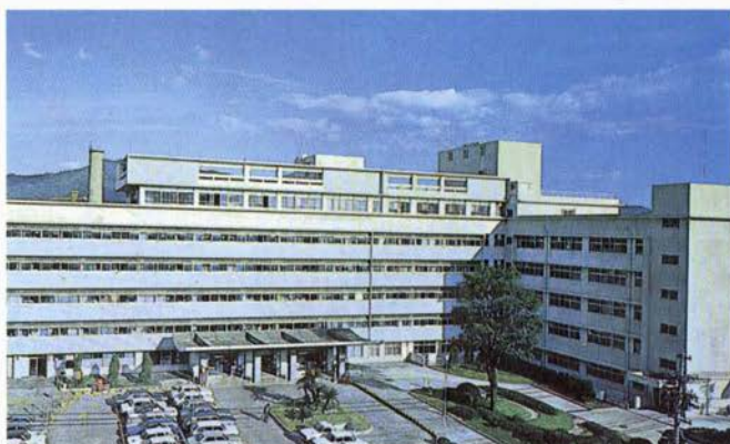
◀▲全景(上)と病院正面(左)(1972年)